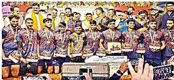
बालक वर्ग की विजेता गुजरात टीम फिनाल, पवई और 51 उपहार वरदान के साथ।