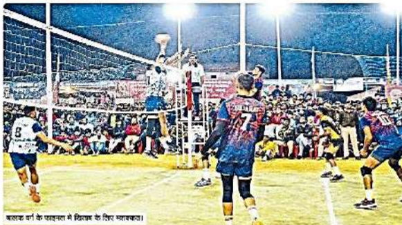
बालक वर्ग के फाइनल में फिनाल के लिए तैयार।

कर्नाटक और गुजरात तीसरे स्थान पर इससे पहले सुबह खेले गए तीसरे स्थान के मैच क्रमशः कर्नाटक और गुजरात के बालक वर्गों में उत्तरप्रदेश पर 31-29, 25-19, 25-22 से जीत मिली। गुजरात ने बालिका वर्गों में तमिलनाडु को 25-10, 25-21, 25-14 से हराया।