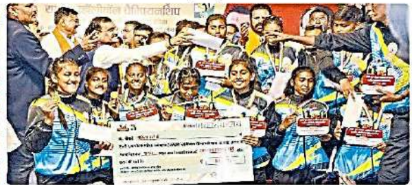
बालिका वर्ग में विजेता राजस्थान टीम का साथ।